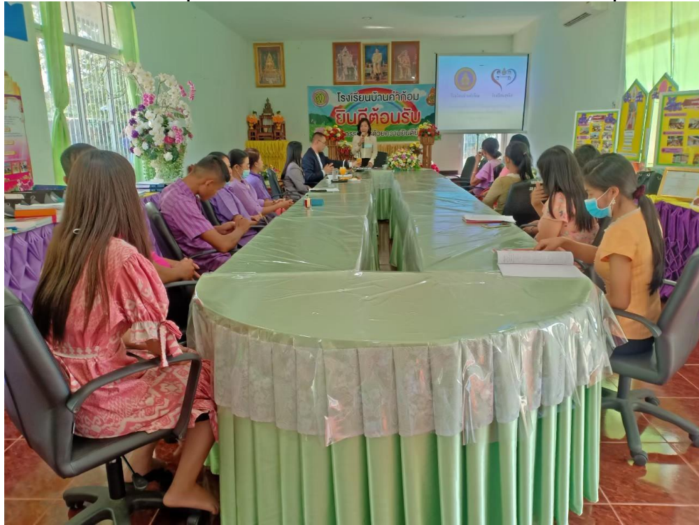
โรงเรียนบ้านคำก้อมได้รับการคัดเลือกให้เป็นตัวแทนโรงเรียนใน สพป.อบ.๓ ที่ได้รับการตรวจสอบภายในผ่านโครงการโรงเรียนสุจริต